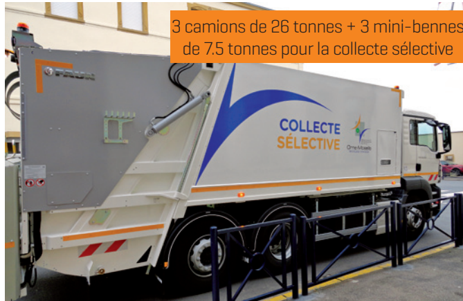
3 camions de 26 tonnes + 3 mini-bennes de 7.5 tonnes pour la collecte sélective

Ils existent aussi en version mini-bennes pour collecter dans les rues étroites ou difficiles d'accès, et pour le verre en porte-à-porte.