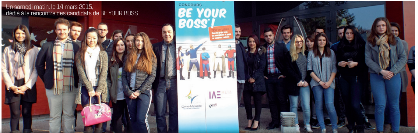
Un samedi matin, le 14 mars 2015, dédié à la rencontre des candidats de BE YOUR BOSS

Un jury composé d'élus, d'entreprises et d'universitaires s'est réuni pour visionner tous les projets déposés sous la forme de vidéos et ainsi faire le choix des lauréats.