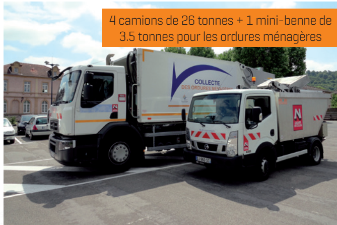
4 camions de 26 tonnes + 1 mini-benne de 3.5 tonnes pour les ordures ménagères