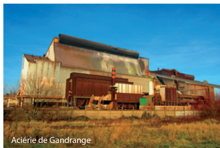
Acierie de Gandrange

– SON CONTENU : 10 enjeux déclinés en actions :