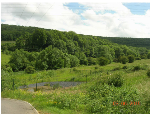
partie technique lagunage