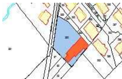
11 rue de la Fontaine