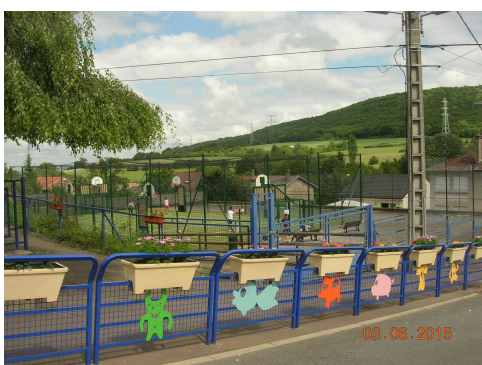
aire de jeux et sports