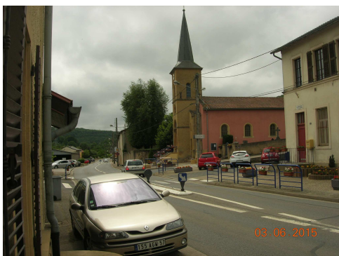
église, cimetière et foyer