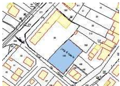
rue de l'Ecoles