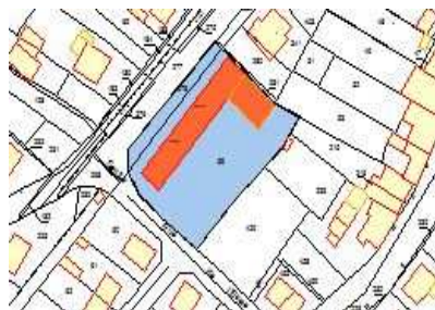
rue des Hauts Blancherons