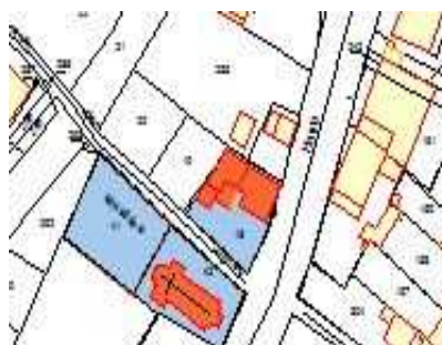
11 rue Haute