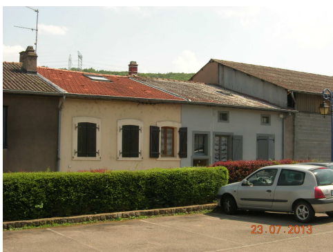
espace public avec stationnement