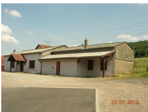
local jeunes MJC