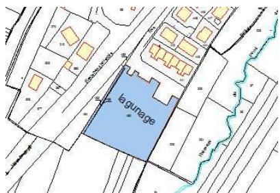
rue du Billeron