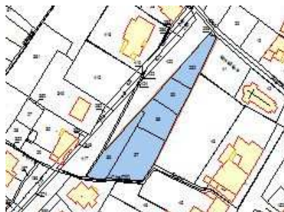
rue des Hauts Blancherons (en face 11)