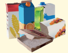
Emballages en carton et briques alimentaires