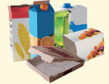
Emballages en carton et briques alimentaires