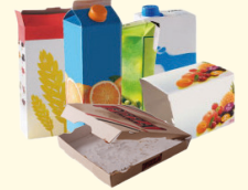
Emballages en carton et briques alimentaires