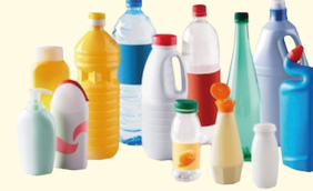
Bouteilles et flacons en plastique

Désormais, c'est simple, tous les emballages et les papiers se trient.