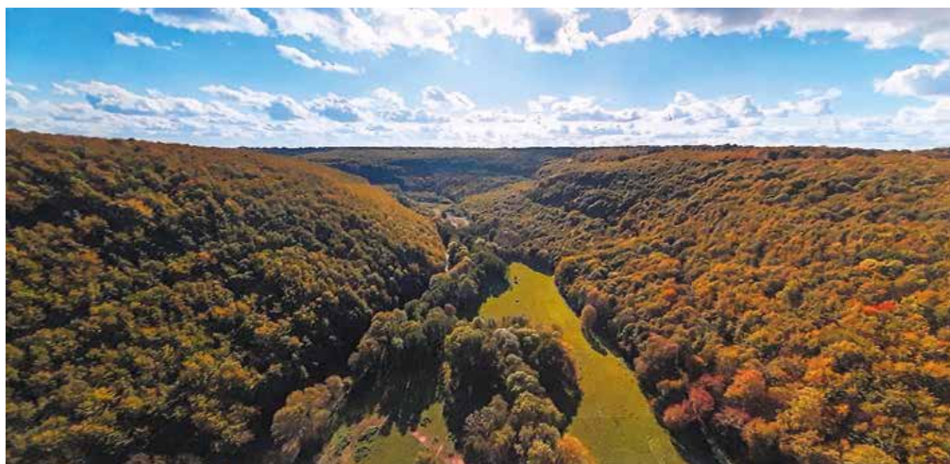
Octobre 2023 : forêt automnale en majesté au Pérotin.